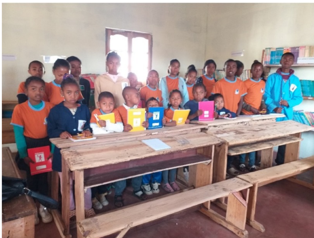
Les enfants parrainés d'Ankazotoho (école de la capitale)

« L'éducation est le meilleur moyen pour libérer l'homme de l'ignorance et de la pauvreté »